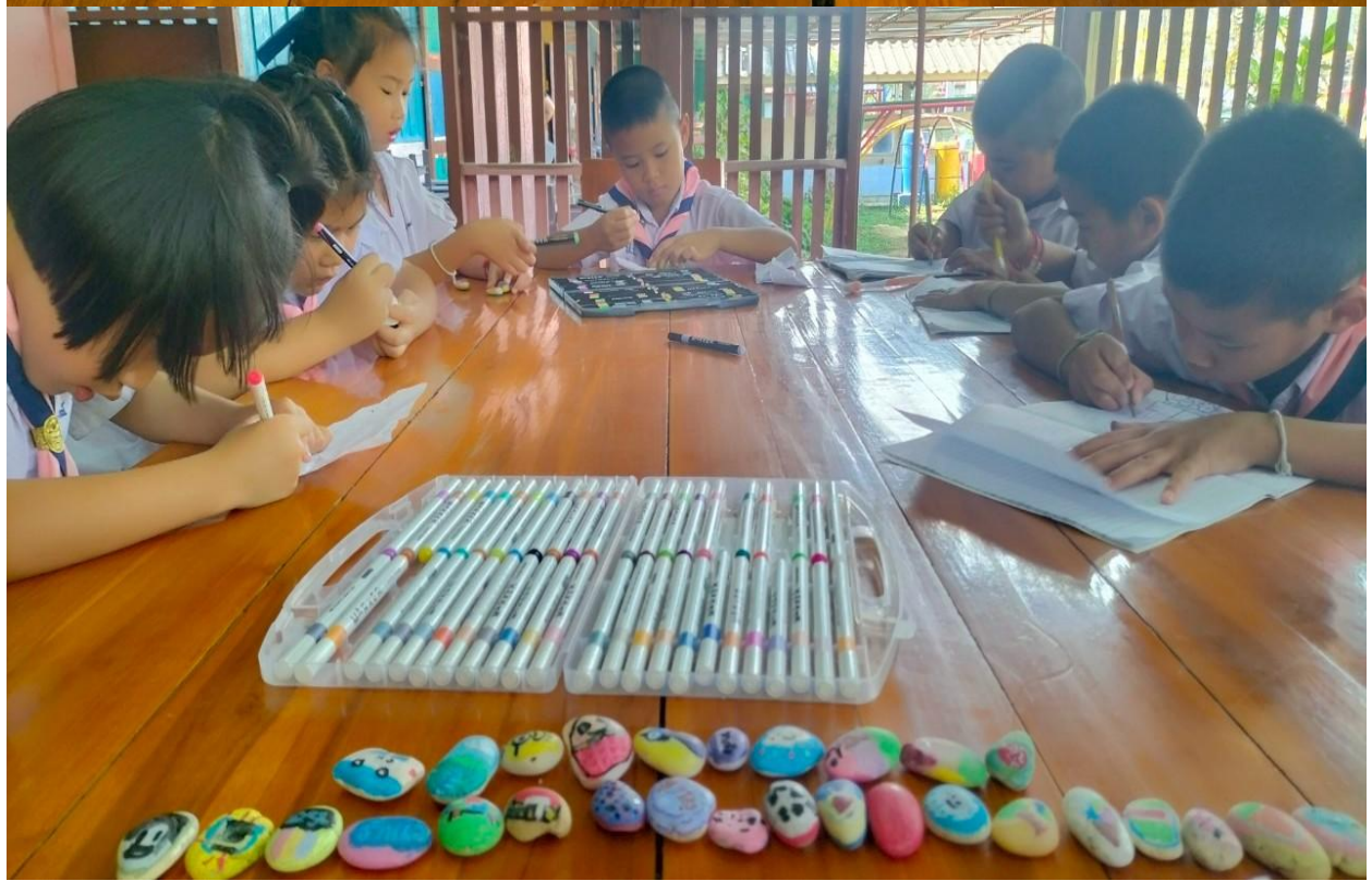
รายงานผลการดำเนินงาน โครงการลดเวลาเรียนเพิ่มเวลารู้