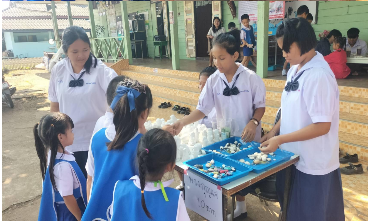
รายงานผลการดำเนินงาน โครงการลดเวลาเรียนเพิ่มเวลารู้