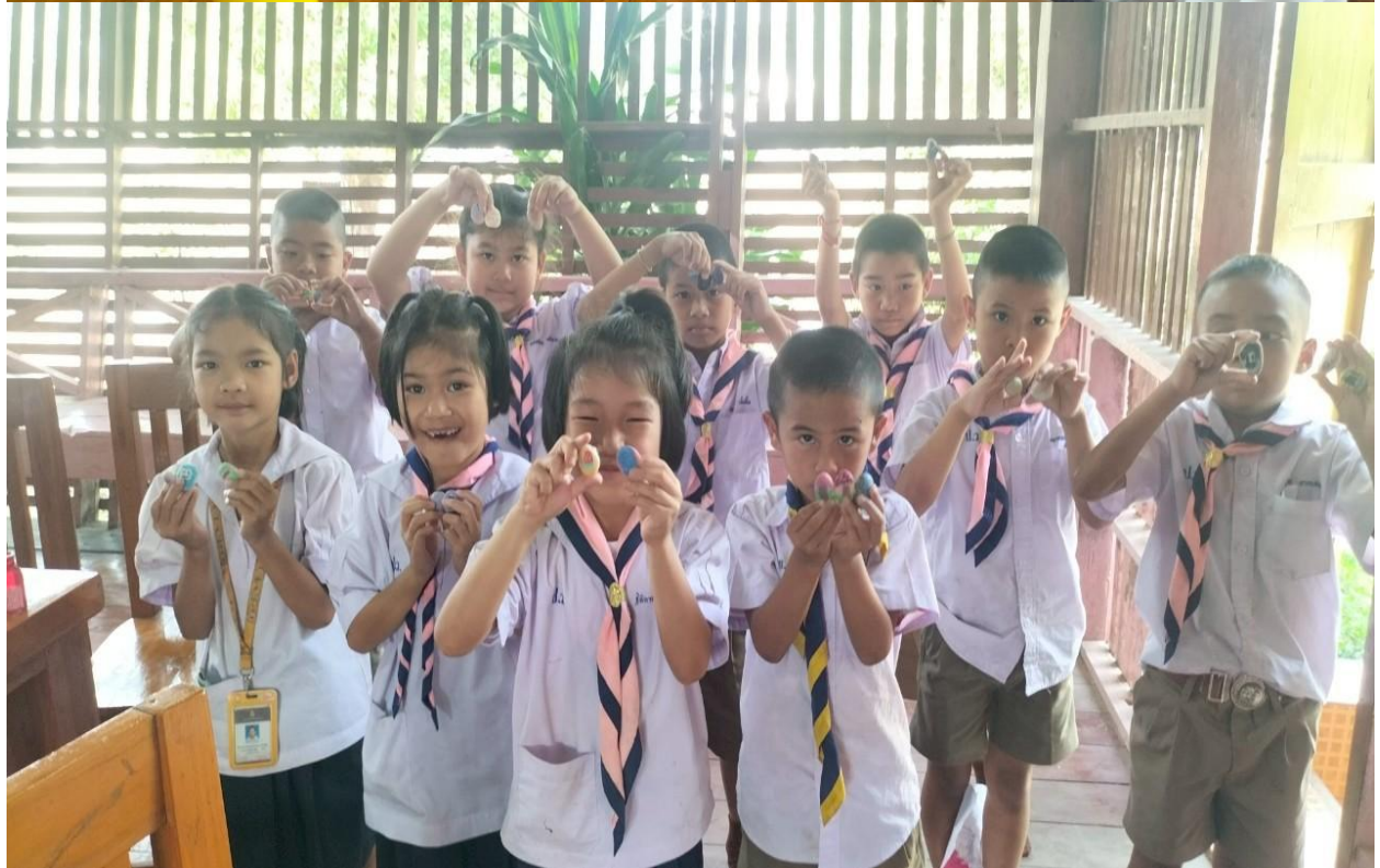
รายงานผลการดำเนินงาน โครงการลดเวลาเรียนเพิ่มเวลารู้