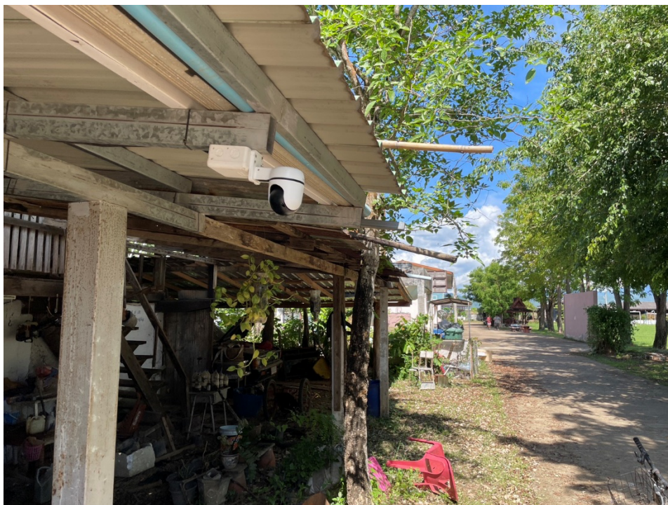
IP Camera ที่ติดตั้งเพิ่ม บริเวณ โรงรถนักเรียน