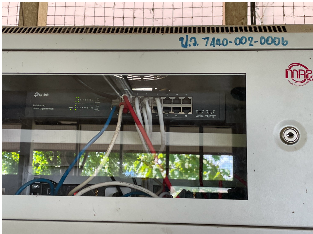
สวิชต์ฮับที่ติดตั้งเพิ่มสำหรับอาคาร 2 เพื่อเพิ่มประสิทธิภาพการบริการอินเทอร์เน็ต