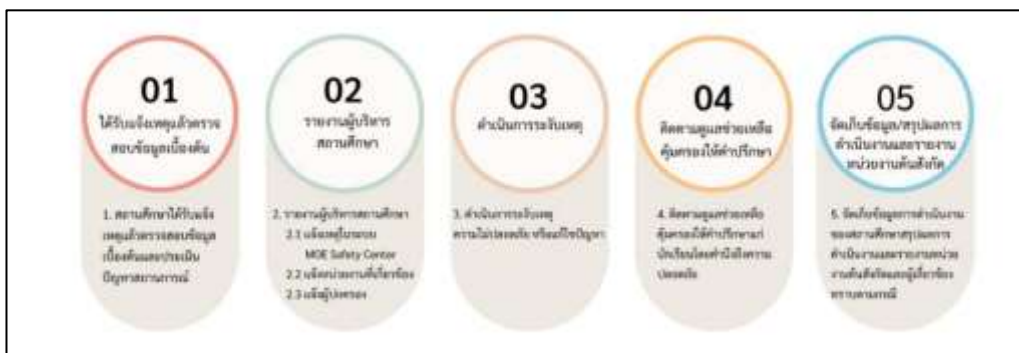
แผนภาพที่ ๒ แนวทางดำเนินการเตรียมพร้อมการเผชิญเหตุ